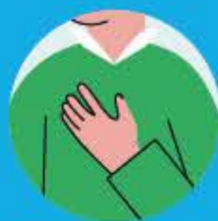
Боль за грудиной